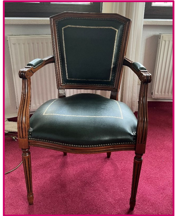
Sessel mit Armlehne (1 Stück)