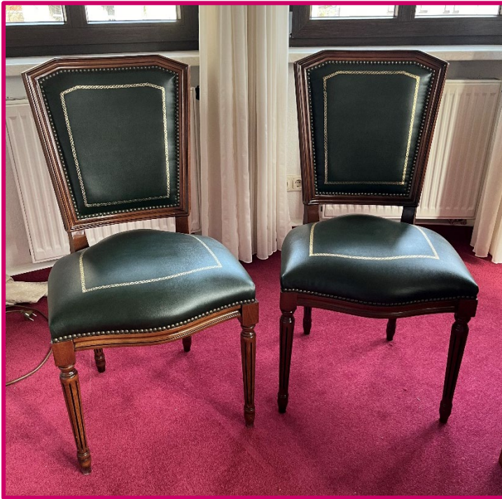
Stühle (insgesamt 22 Stück)